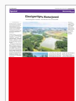
M2 (1/2 Seite) 251 x 188 mm