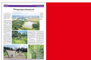
M1 (1/1 Seite) 251 x 376 mm