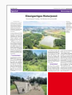
M14 98 x 100 mm