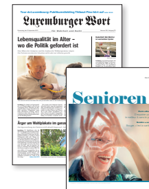
Luxemburger Wort Sonderbeilage Senioren Herbstedition Magazinformat