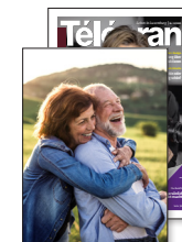
Télécran Themendossier Senioren Herbstedition