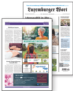
Luxemburger Wort Monatliche Sonderseiten