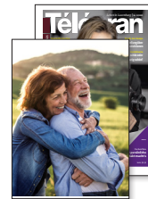
Télécran Themendossier Frühjahrsedition