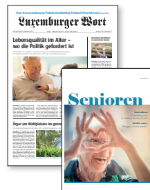
Luxemburger Wort Sonderbeilage Senioren Frühjahrsedition Magazinformat

ENTDECKEN SIE JEDEN MONAT EIN SPEZIELLES THEMA, DAS BESONDERS SENIOREN INTERESSIERT!