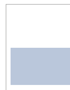
1/2 page 200 x 124 mm SANS fausse coupe