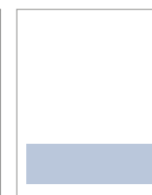
1/4 bandeau 200 x 62 mm SANS fausse coupe