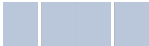
Cover 2 / 3 / 4 230 x 295 mm + 3 mm fausse coupe

Pour les formats « plein papier », prévoir une fausse coupe de 3 mm sur les 4 côtés. Le texte doit se trouver à une distance minimum de 10 mm des bords rognés.