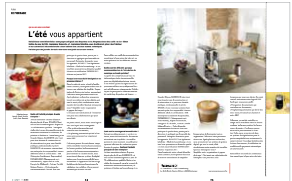
(Layout par nos soins suivant gabarit)

Publications en quadrichromie. Prix en euros, hors TVA et frais de production.