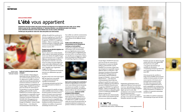
(Seitenlayout von uns nach Vorlage)

Vierfarbendruck. Alle Preise in Euro, zzgl. MwSt. und Produktionskosten.