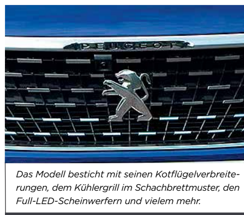
Das Modell besticht mit seinen Kotflügelverbreiterungen, dem Kühlergrill im Schachbrettmuster, den Full-LED-Scheinwerfern und vielem mehr.

Der dreifach adaptive Tempomat und der Abstandhalter erfüllen ihre Aufgabe zuverlässig.