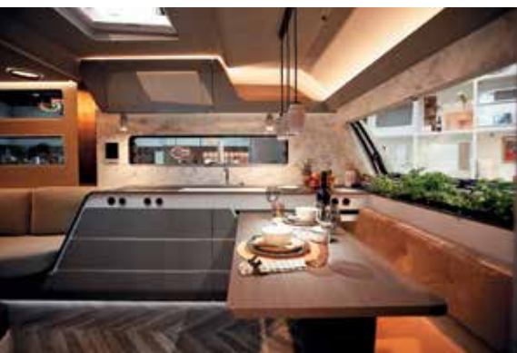
Im Konzeptwohnwagen der Marke Bürstner wird die Zukunft erlebbar.

als 160 000 verkauften Exemplaren „das weltweit erfolgreichste Reisemobil“.