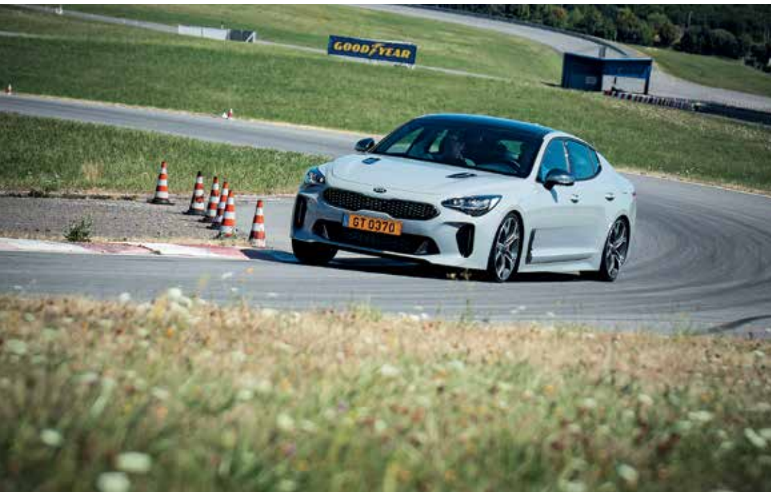
Sowohl der Allradantrieb als auch die Fahrhilfen tragen aktiv dazu bei, dass der Wagen sicher und stabil auf der Straße liegt.

Wer braucht schon Schnickschnack in einem Sportwagen? Hier soll es ums Gefühl gehen, und das ist gelungen.