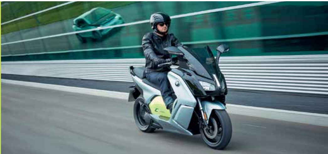
Selbst optisch ansprechend, wirkt der Scooter zuerst doch unscheinbar. Dieser Eindruck verfliegt aber, sobald er in Aktion tritt.

Auf den ersten 20 Metern nach dem Start lässt er so manches Supersport-Motorrad hinter sich.