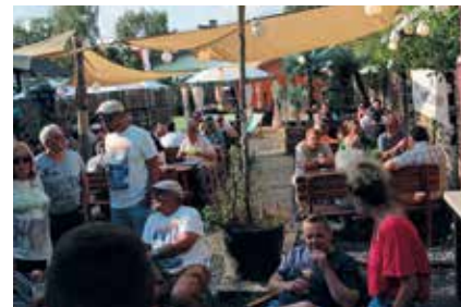
Abends zurück im Préizerdau, werden die letzten Erfahrungen ausgetauscht und die Sieger gekürt.

Routinierter geht es nach dem Drei-Gänge-Menü an den zweiten Teil der Rallye. Die Copilotin und ich sind nun ein eingespieltes Team. Was vormittags eher eine oft wilde Diskussion war, ist nun ein knappes „K-Links“, „K-Rechts“ (K = Kreuzung). Klar, immer den Pfeilen nach. Die Temperaturen steigen, und dies nicht nur im Motorraum. Der Vierzylinder kämpft mit dem häufigen Bergauf und Bergab. Richtig fies sind ja auch die kleinen Fallen, die im Roadbook eingebaut wurden. Schnell ist mal eine Straße falsch angefahren oder der falsche Buchstabe aufgeschrieben. Clever gemacht. Anhand dieser Notizen können die Organisatoren herausfinden, ob die Teams richtig