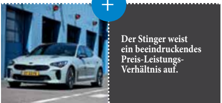
Der Stinger weist ein beeindruckendes Preis-Leistungs-Verhältnis auf.