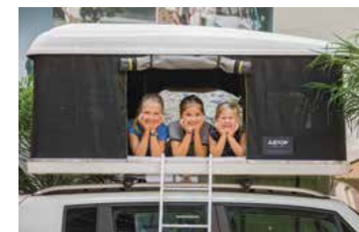
Platz ist in der kleinsten Hütte: Manchmal tut's auch ein Dachzelt.

Die Alkoven-Reisemobile feierten eine Art Revival. Als ideale Familienfahrzeuge - mit einer Schlafnische oberhalb des Fahrerhauses - erlebten sie derzeit eine Renaissance, hieß es in Düsseldorf, darunter auch die Baureihe Siesta de Luxe der Marke Hobby. Im Trend liegen ferner kompakte Fahrzeuge, viele Vans und Kastenwagen wurden präsentiert. Für besondere Abenteurer eignen sich Autodachzelte - etwa das aus der zum Hymer-Konzern gehörenden