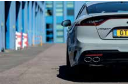
Egal aus welchem Winkel man ihn auch betrachtet: Der Kia Stinger verbindet Sportlichkeit mit Modernität.

Fahrtechnisch macht der Stinger sehr viel Spaß. Die allgemeine Balance zwischen Technik und Mechanik trägt definitiv dazu bei. Treibt einem das Motorengrollen einen wohligen Schauer über den Rücken, sollte man trotz allem auf das sensible Gaspedal achten. Schnell ist man über der Geschwindigkeitsbegrenzung, ohne es überhaupt bemerkt zu haben. Der Allradantrieb leistet solide