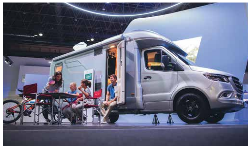
Bei Hymer stand die neue B-Klasse ModernComfort im Rampenlicht.

Bei Hymer zog die B-Klasse ModernComfort mit einer Länge von 6,99 und 7,39 Metern und jeweils 2,29 Meter Breite die Blicke auf sich. Sie basiert auf dem neuen Mercedes Sprinter. Die Verwendung des Sprinter-