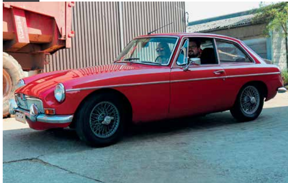
Nach dem Mittagessen sind Copilotin und Pilot ein eingespieltes Team.

Roadbook. Immer mal wieder gibt es kleine Schilder zu notieren, Stempel an Wegpunkten abzuholen und die eine oder andere Frage entlang der Strecke zu beantworten. Die Copilotin hat alle Hände voll zu tun und macht das, für ihr erstes Mal, sehr souverän. Respekt! Es herrscht eine entspannte Stimmung im Auto. Das gute Wetter und die Musik machen ein übriges. Natürlich läuft, passend zum Alter des Autos, Musik aus den 1970er-Jahren.