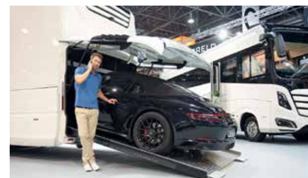
Der Morelo Empire Liner verfügt über eine Garage im Heck und kann einen Porsche 911 an Bord nehmen.

Mit einer Weltpremiere wartete Volkswagen auf: dem Grand California der Baureihe 600 oder 680. Die Reisemobile der Sechs-Meter-Klasse wurden komplett neu entwickelt, auf Crafter-Basis, vollständig ausgestattet mit Bad, WC, Bett und Gasversorgung. Die Markteinführung