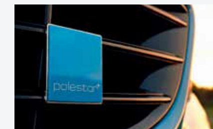
Das blaue Polestar-Quadrat steht für Dynamik.

Eine für die Performance-Optimierung entwickelte Software verbessert laut Volvo die Drehmomentverteilung an die Hinterräder und ermöglicht auf diese Weise eine noch sportlichere Fahrweise. Dazu kommen ein besseres Einlenkverhalten, präziseres und sichereres