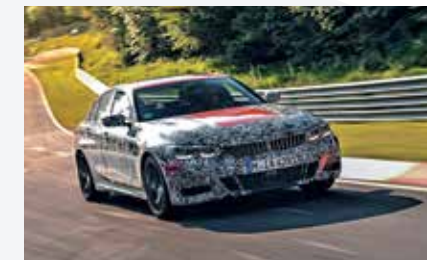
Beim noch leicht getarnten, neuen 3er legt BMW am Nürburgring letzte Hand an.

Denn es hat sich viel getan: Der neue 3er ist bis zu 55 Kilo leichter als sein noch aktueller Vorgänger, der Schwerpunkt liegt um zehn Millimeter tiefer, die Steifigkeit der Karosserie ist deutlich höher. Dazu wurden noch die Spurbreiten vergrößert und „erhöhte Radsturzwerte bieten zusätzliches Potenzial für maximale Querdynamik“, heißt