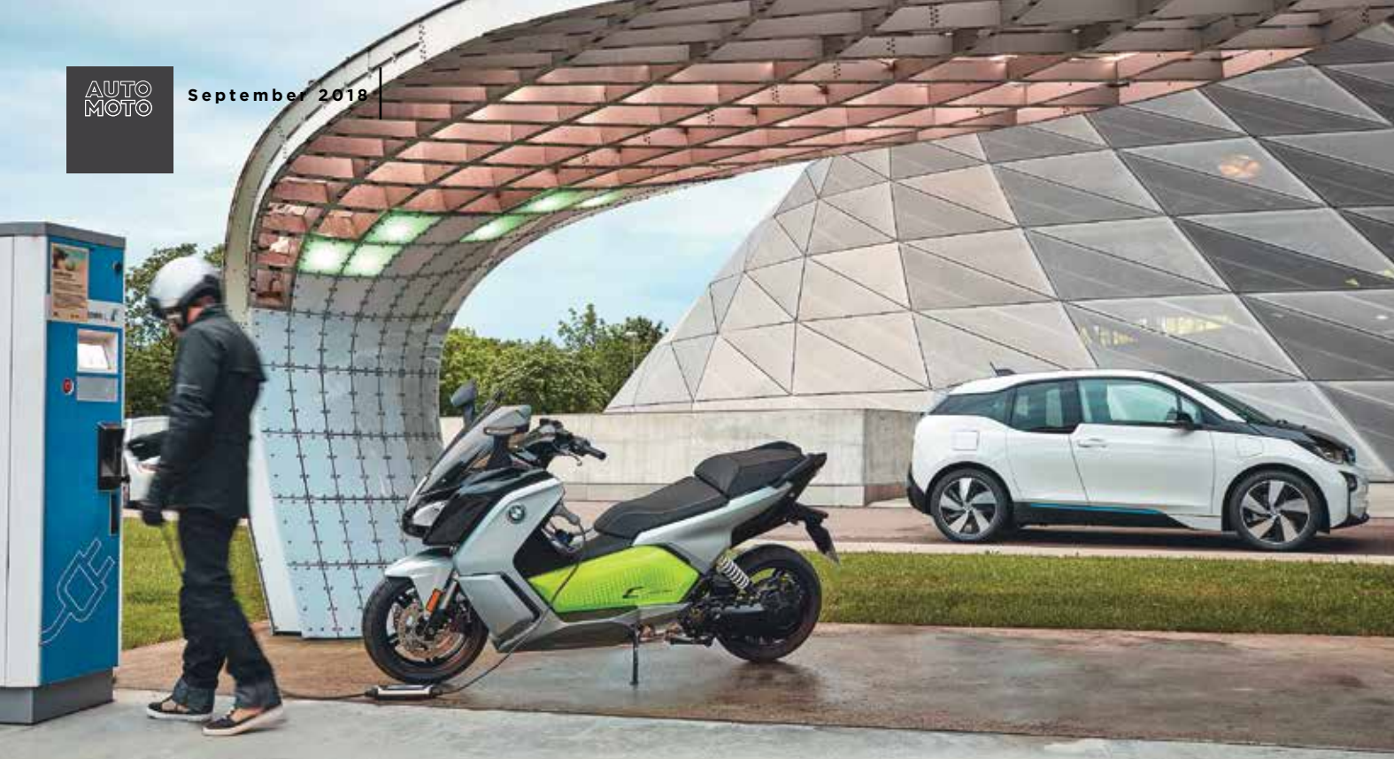
Ladetechnisch lässt sich das Zweirad problemlos an allen Stationen sowie Steckdosen anbringen. Voraussicht optimiert die Reichweite.

weniger Kraft, dafür aber bis zu 20 Prozent höhere Reichweite. „Sail“ bringt entspanntes Dahingleiten ohne Rekuperation. Der interessanteste heißt jedoch eindeutig „Dynamic“: Volle Leistung und deutliche Rekuperation, dabei immer noch praxisingerechte Reichweite für die typischen Stadtfahrten mit einem Roller.