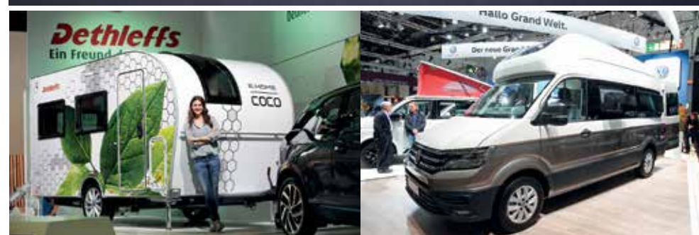
Mit elektrischen Radnabenmotoren: der e.home coco der Firma Dethleffs.