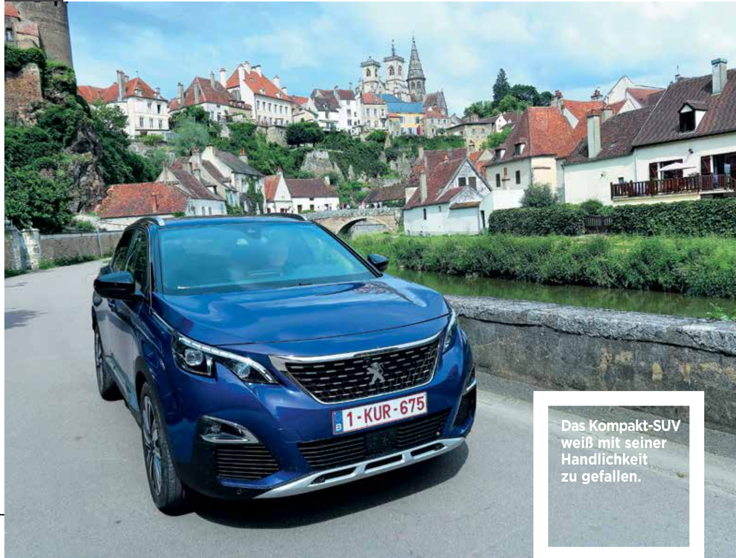
Bei Semur-en-Auxois am Ufer des Armançon, im Hintergrund die Stiftskirche Notre-Dame.

Das Kompakt-SUV weiß mit seiner Handlichkeit zu gefallen.